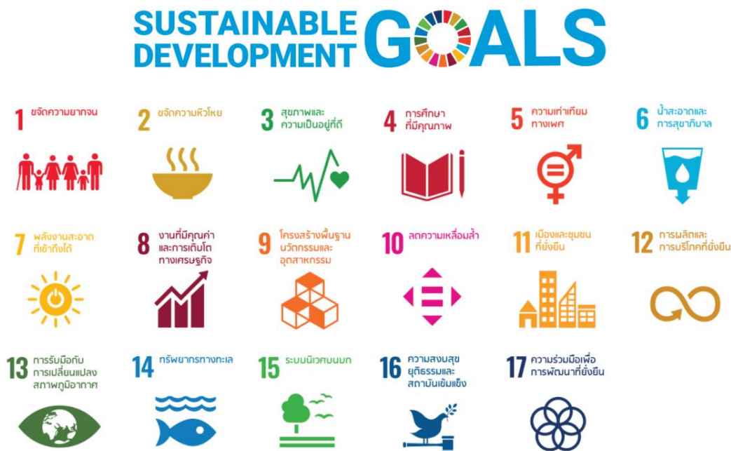
รูปที่ ๑ Sustainable Development Goals : SDGs ๑๗ เป้าหมาย

องค์การสหประชาชาติ ได้จัดทำวาระการพัฒนากายหลังปี ค.ศ. ๒๐๑๕ (post-๒๐๑๕ development agenda) มีวัตถุประสงค์เพื่อมุ่งขจัดความยากจนในทุกมิติและทุกรูปแบบ โดยมีเป้าหมายการพัฒนาที่ยั่งยืน เป็นกรอบกำหนดทิศทางการพัฒนาที่ยั่งยืนของโลกในอีก ๑๕ ปี ข้างหน้า (พ.ศ. ๒๕๕๙ - ๒๕๗๓) ซึ่งครอบคลุม ๓ เสาหลักการพัฒนาที่ยั่งยืน คือ เศรษฐกิจ สังคม และสิ่งแวดล้อม รวมถึงความเชื่อมโยงระหว่างมิติต่าง ๆ เพื่อให้บรรลุถึงการพัฒนาที่ยั่งยืน ประกอบด้วย ๑๗ เป้าหมาย ๑๖๙ เป้าหมายย่อย เป้าหมายที่เกี่ยวข้องกับกรมตรวจบัญชีสหกรณ์ จำนวน ๒ เป้าหมาย ได้แก่